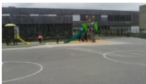
Une structure de jeux du square des bruyères a trouvé sa nouvelle place pour le plus grand plaisir des enfants.