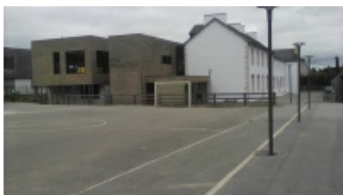
Le ravalement de l'ancien bâtiment de l'école publique a été effectué.

Cependant, l'été n'est pas synonyme de vacances pour tout le monde :