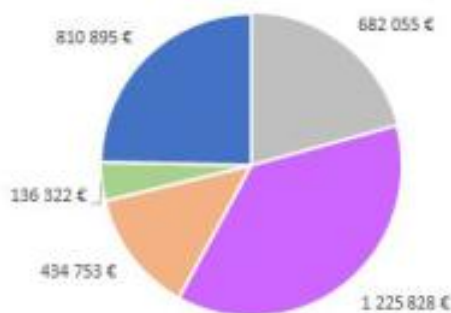
DEPENSES DE FONCTIONNEMENT - ANNEE 2017

- Fonctionnement = 302 730 € - Investissement = 444 200 €